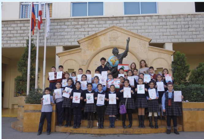
Abb. 2: Der Verein hilft den armenischen Kindern im Libanon um ihnen den Schulbesuch zu ermöglichen