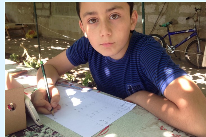
Abb. 3: Online Betreuung während des Lockdowns

Die Region Tawusch war besonders betroffen während des Konflikts zwischen Armenien und Aserbaidschan. In diesem Sinne ist es besonders wichtig dass die Gemeinden an der Grenze besonders verstärkt werden damit die Bevölkerung ihre Region nicht verlässt. Armenien Fonds unterstützt seit mehreren Jahren die Kinder aus der Region im Rahmen des Projekts „Unterstützung der Kinder in der Gemeinde Berd aus sozial-schwachen Familien“. Hier werden die Kinder nach der Schule betreut. In der Zeit von Corona werden sie Online betreut. Das Rote Kreuz Baden-Württemberg hat eine Zweigstelle (House of Hope) in Armenien. Wir haben eine Summe von 17.000 € an sie überwiesen. Die Summe wird für die Betreuung von 120 Kindern aus 5 Dörfern in Berd Region (Dörfer: Berd, Artsvaberd, Nerqin Karmiraghbyur, Paravaqar and Navur) eingesetzt. Das Projekt ist bis August 2021 geplant. Wir hoffen auf Ihre zahlreichen Spenden um das Projekt weiterhin zu ermöglichen.