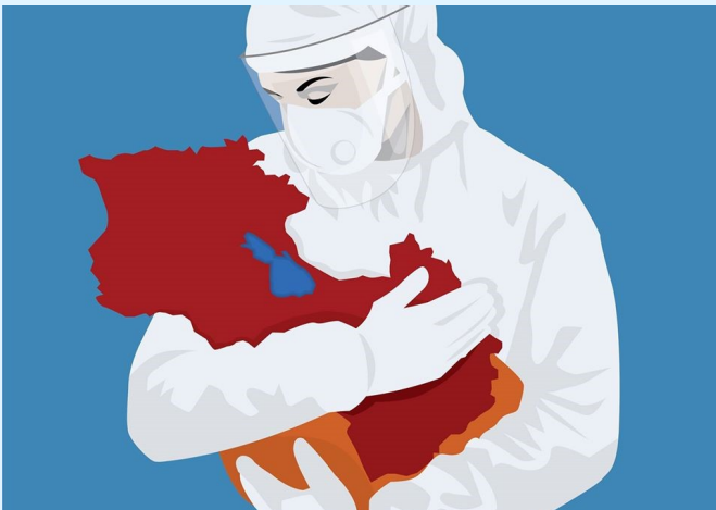
Abb. 1: Corona hat unser Leben verändert. Entsprechend haben wir uns an die Lage angepasst um unsere Landsleute möglichst gut in dieser harten Zeit zu unterstützen.

Für all diese und andere Ereignisse hat Armenien-Fonds eine Reaktion gezeigt und bemüht sich den Leuten vor Ort zu helfen. Denn unser Motto ist: 365 Tage im Jahr ehrenamtlich für Sie im Einsatz zu sein.