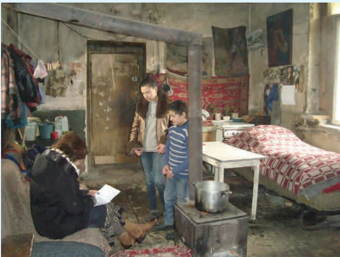
Abb. 6: Die Lebensbedingungen in den Blechhütten sind sehr schlecht. Weitere Familien brauchen noch Ihre Unterstützung!